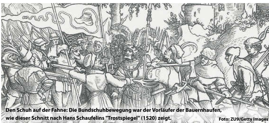
Den Schuh auf der Fahne: Die Bundschuhbewegung war der Vorläufer der Bauernhaufen, wie dieser Schnitt nach Hans Schaufelins "Trostspiegel" (1520) zeigt.

In Baden-Württemberg werden den aufständischen Bauern dieses Jahr etliche Veranstaltungen und Ausstellungen gewidmet. So hat das Landesmuseum Württemberg gleich mehrere große Projekte auf den Weg gebracht: Von der Erlebnisausstellung „Protest!“ in Stuttgart über spektakuläre KI-Projekte („Uffruhr!“) in Bad Schussenried, die auch mobil unterwegs ist oder einer Kinderausstellung („Zoff!“). Doch auch an den historischen Stätten im Kraichgau, Heilbronn oder Böblingen ist zum 500. Jahrestag der Aufstände einiges an Programm geboten. (js)