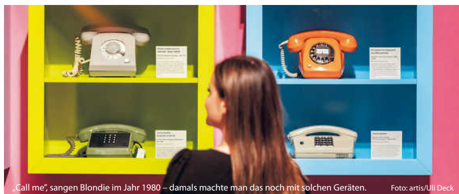
„Call me“, sangen Blondie im Jahr 1980 – damals machte man das noch mit solchen Geräten.

Heinz Rudolf Kunze stellte seine Gitarre bereit, Thomas Anders von Modern Talking den Bravo-Otto, Steffi Graf ihre Goldmedaille von Seoul. Und im November folgt ein weiteres Highlight: Udo Lindbergs legendäre Gitarre mit der Aufschrift „Gitarren statt Knarren“, die der Sänger 1983 Erich Honecker überreichte, findet dann ihren Weg nach Karlsruhe. Grund genug, sich einmal auf Zeitreise zu begeben, oder? (jr/tam)