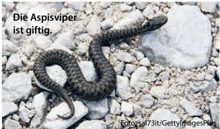
Die Aspispiper ist giftig.