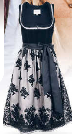
Krüger collection Dirndl – Modell BONNIE, inkl. Spitzenschürze, 70 cm 299,00 €*