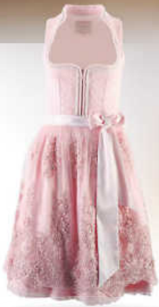
Krüger collection Dirndl – Modell ROSÉ GLOW, inkl. Spitzenschürze, 60 cm 269,00 €*