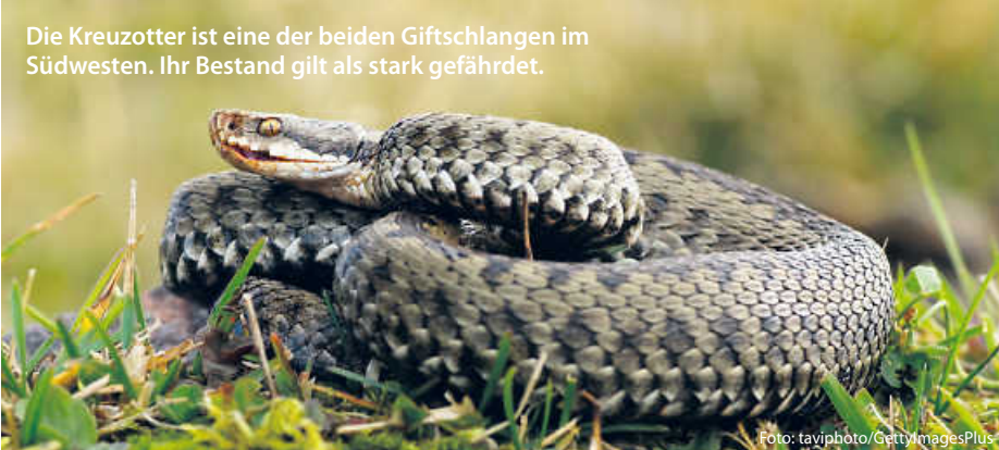
Die Kreuzotter ist eine der beiden Giftschlangen im Südwesten. Ihr Bestand gilt als stark gefährdet.