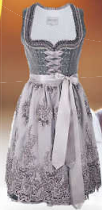
Krüger collection Dirndl – Modell THERESA, inkl. Spitzenschürze, 60 cm 249,00 €*