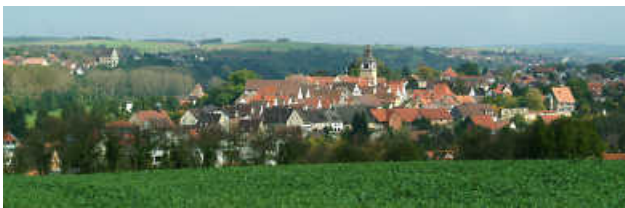
Neuenstadt am Kocher - die freundliche Stadt