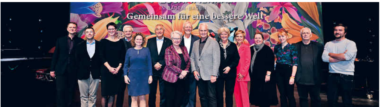
Impressionen vom Forum für Gesellschaftlichen Zusammenhalt 2022 in Baden-Baden.

Buchen Sie jetzt Ihre kostenlosen Tickets!