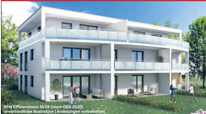
KfW Effizienzhaus 55 EE (nach GEG 2020) unverbindliche Illustration | Änderungen vorbehalten