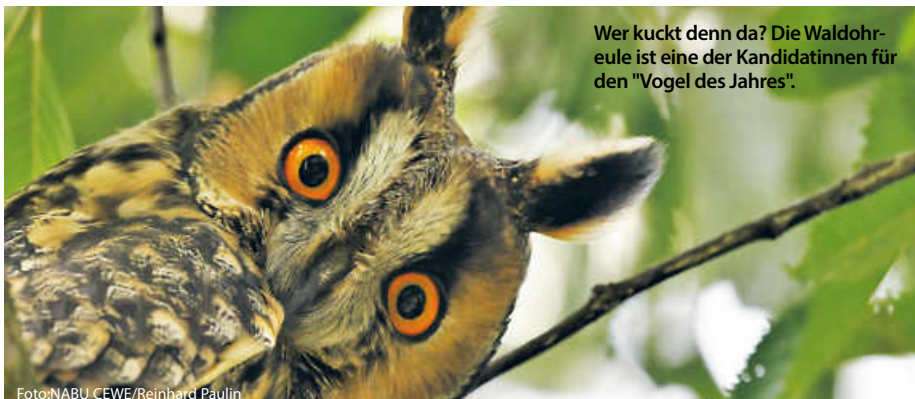
Wer kuckt denn da? Die Waldohreule ist eine der Kandidatinnen für den "Vogel des Jahres".

Die Waldohreule ( Asio otus ) ist hinter dem Waldkauz die häufigste Eulenart in Baden-Württemberg. Optisch ähnelt sie dem Uhu, ist aber kleiner und schlanker. Ihre „Ohren“ sind Federpuschel ohne Hörfunktion. Die Waldohreule lebt unter anderem in lichten Wäldern, jagt Mäuse und Wühlmäuse und nistet gern in alten Krähenestern. Bei der nächtlichen Jagd ortet sie ihre Beute akustisch. Ihr Wahlslogan: „Ohren auf: Natur an!“ (pm/red)