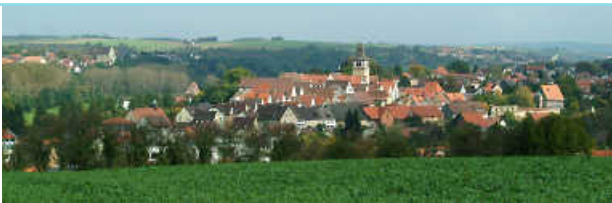
Neuenstadt am Kocher - die Freundliche Stadt