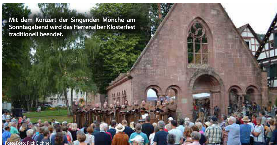
Mit dem Konzert der Singenden Mönche am Sonntagabend wird das Herrenalber Klosterfest traditionell beendet.

Neue Kunstwerke und Designobjekte werden bei der Ornamenta in außergewöhnlichen, nicht institutionellen Kontexten gezeigt, wodurch der Nordschwarzwald selbst zum Ausstellungsraum wird. So möchte die Ornamenta Beziehungen zwischen einem lokalen, nationalen und internationalen Publikum stärken. (ps/red)