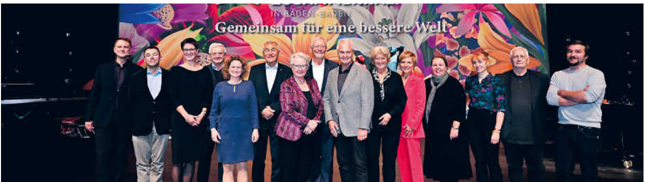
Impressionen vom Forum für Gesellschaftlichen Zusammenhalt 2022 in Baden-Baden.

Buchen Sie jetzt Ihre kostenlosen Tickets!