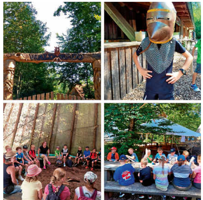
Ritterprogramm und Wildtierpark