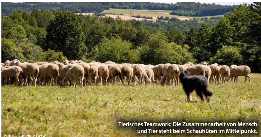
Tierisches Teamwork: Die Zusammenarbeit von Mensch und Tier steht beim Schauhüten im Mittelpunkt.

Kurzum: Sie sind mit ihrer Mischung aus Geschichte, Kultur und Unterhaltung ein beeindruckendes Beispiel für gelebte Tradition und ein Muss für jeden, der die Region und ihre Menschen kennenlernen möchte. (jr)