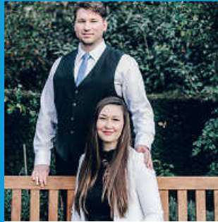
Frau Maurer - Bestattermeisterin Herr Maurer - Bildhauermeister