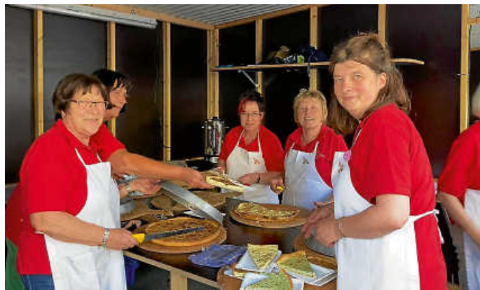
.... und sofort in den Verkauf.