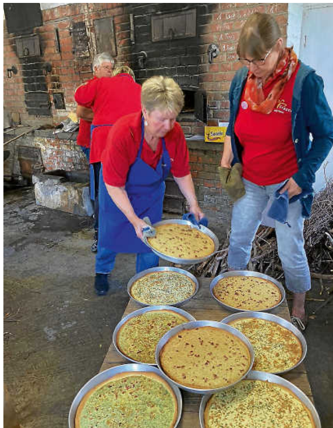
Die Kuchen kamen frisch aus dem Backofen .....