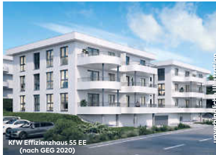
KFW Effizienzhaus 55 EE (nach GEG 2020)

Wohnen für Junioren & Senioren: Moderne 3½-Zimmer-Eigentumswohnungen mit Terrasse im Mannlehenfeld II, auf Wunsch mit Seniorenbetreuung durch die AWO , kurzfristig beziehbar, Tiefgarage, Außenabstellplätze & vieles mehr!