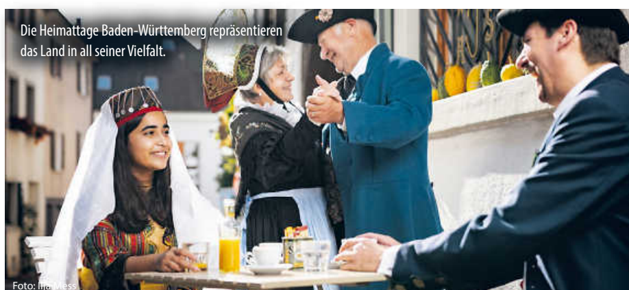
Die Heimattage Baden-Württemberg repräsentieren das Land in all seiner Vielfalt.