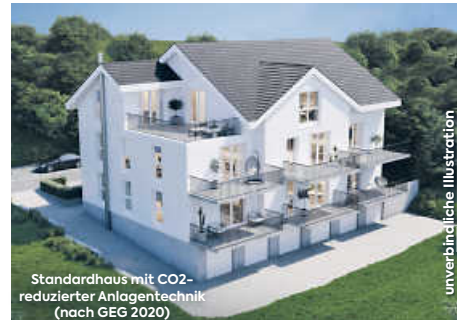
Standardhaus mit CO2-reduzierter Anlagentechnik (nach GEG 2020)

Attraktive 2½, 3½- & 4½-Zimmer-Eigentumswohnungen in naturnaher Lage im Waldfeld mit Balkon, Tageslichtbad, Fußbodenheizung, Aufzug, Tiefgarage, Außenabstellplätze und viele weitere Extras! Innenausbau begonnen.