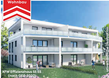
KFW Effizienzhaus 55 EE (nach GEG 2020)