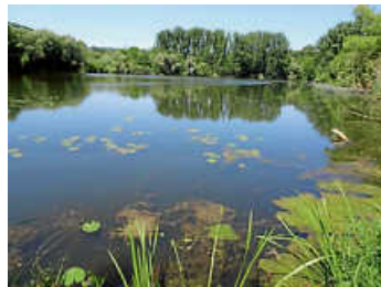
Das Naturschutzgebiet Böttinger Baggerseen in Gundelsheim feiert 2024 sein 40-jähriges Jubiläum.

Ort: Vereinsheim Sportanglerverein Gundelsheim beim Naturschutzgebiet Böttinger Baggerseen in Gundelsheim-Böttingen Eintritt frei.