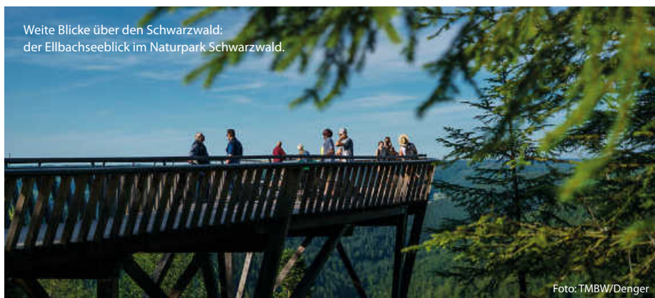
Weite Blicke über den Schwarzwald: der Ellbachseeblick im Naturpark Schwarzwald.

Schon von Weitem ist der Aussichtsturm im Naturpark Schönbuch zu sehen. Die 35 Meter hohe Holz-Stahl-Konstruktion auf dem Stellberg ragt weit über die umliegenden Bäume im ältesten Naturpark Baden-Württembergs hinaus. 348 Stufen erschließen den filigranen Turm und führen zu drei Aussichtsplattformen in 10, 20 und 30 Metern Höhe. Ganz oben kann man nicht nur dem Schönbuch auf sein Blätterdach schauen; auch die Schwäbische Alb und der Schwarzwald erscheinen von hier zum Greifen nah. (TMBW/red)