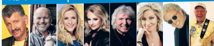
Semino Rossi, Olaf Henning, Stefanie Hertel, Nicole, Peter Orloff, Claudia Jung, Bernie Paul und Graham Bonney

Weitere Infos unter: www.schlager-kanaren.de